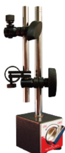
MS - NF80K