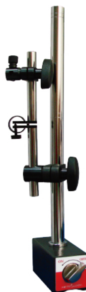
MS - NF130K